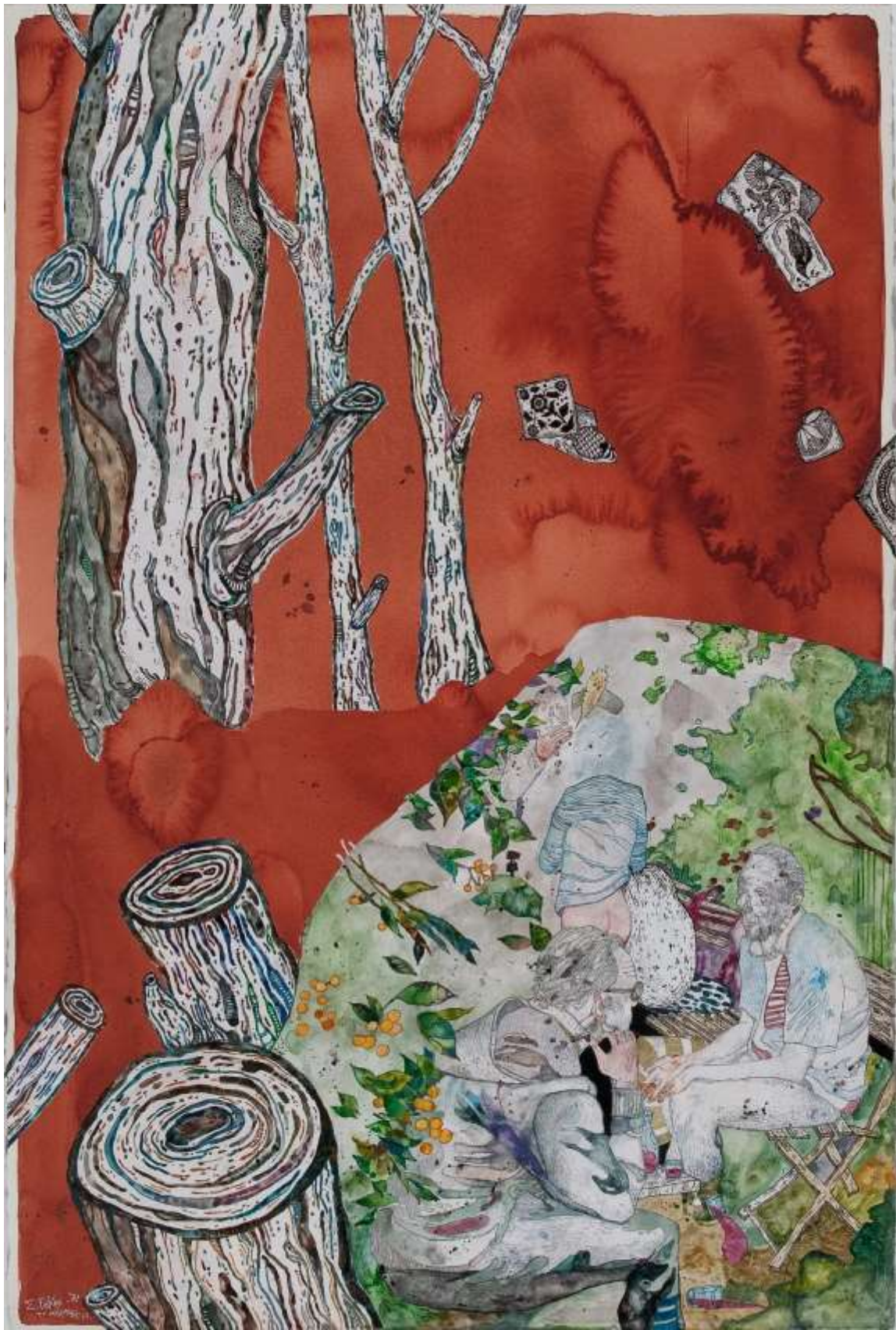
Το πάρτυ, 2014, Μεικτή τεχνική σε χαρτί | Mixed media on paper, 72 x 170 εκ. | cm