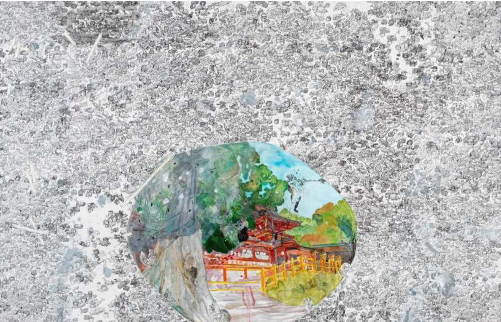
Nara, 29 Νοεμβρίου 2019, 8 εκατομμύρια Κάμι | Nara, 29 November 2019, 8 million Kami 2021 Μεικτή τεχνική σε μουσαμά | Mixed media on canvas, 190 x 300 εκ. | cm