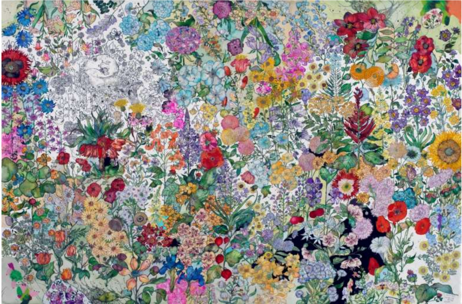
Darker with the day, 2017, Μεικτή τεχνική σε χαρτί | Mixed media on paper, 150 x 100 εκ. | cm