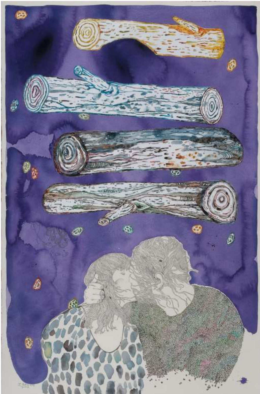
Landscapes, 2013, Μεικτή τεχνική σε χαρτί | Mixed media on paper, 70 x 100 εκ. | cm