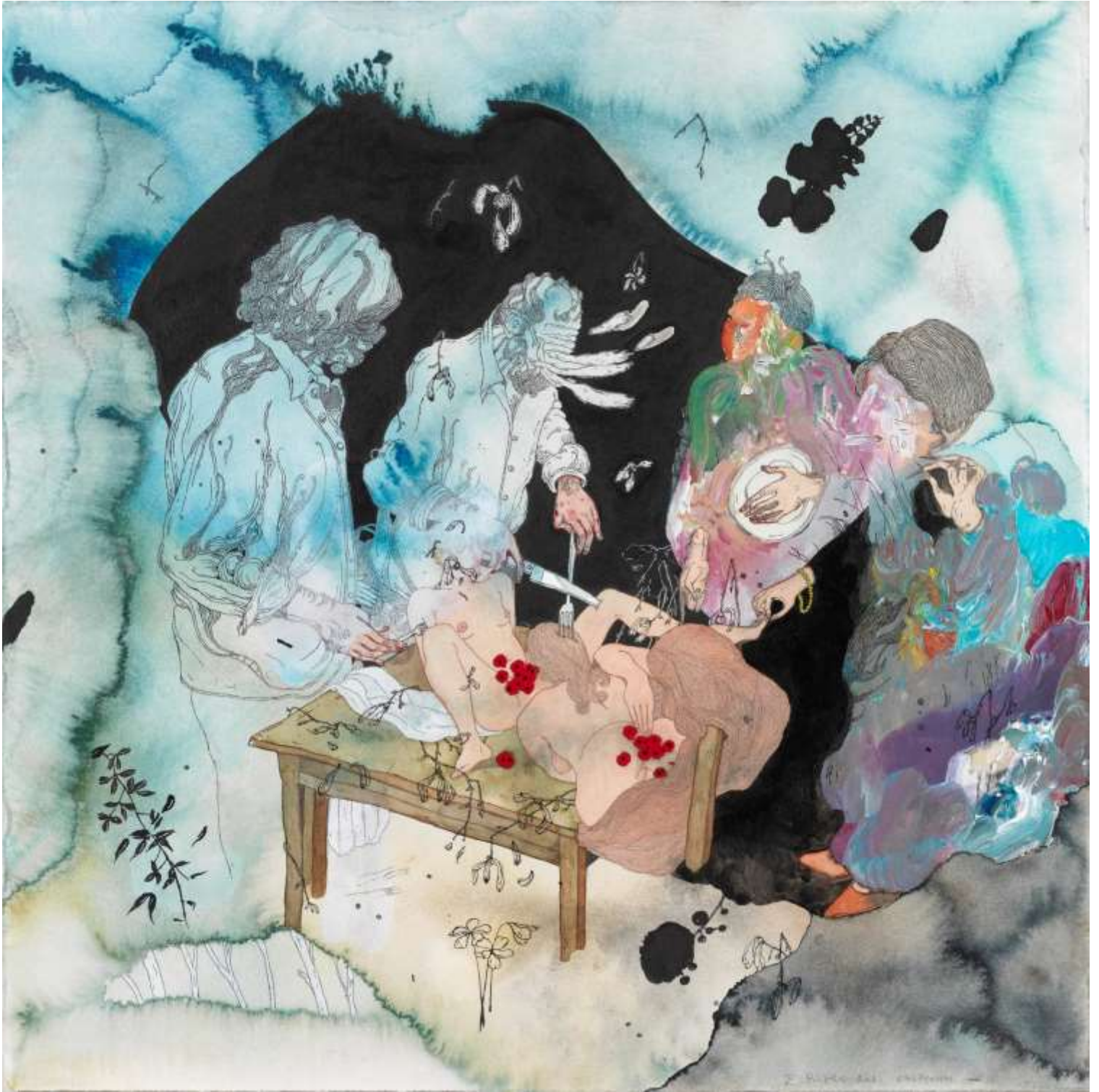
Συνάθροιση 3, 2021, Μεικτή τεχνική σε χαρτί | Mixed media on paper, 70 x 70 εκ. | cm