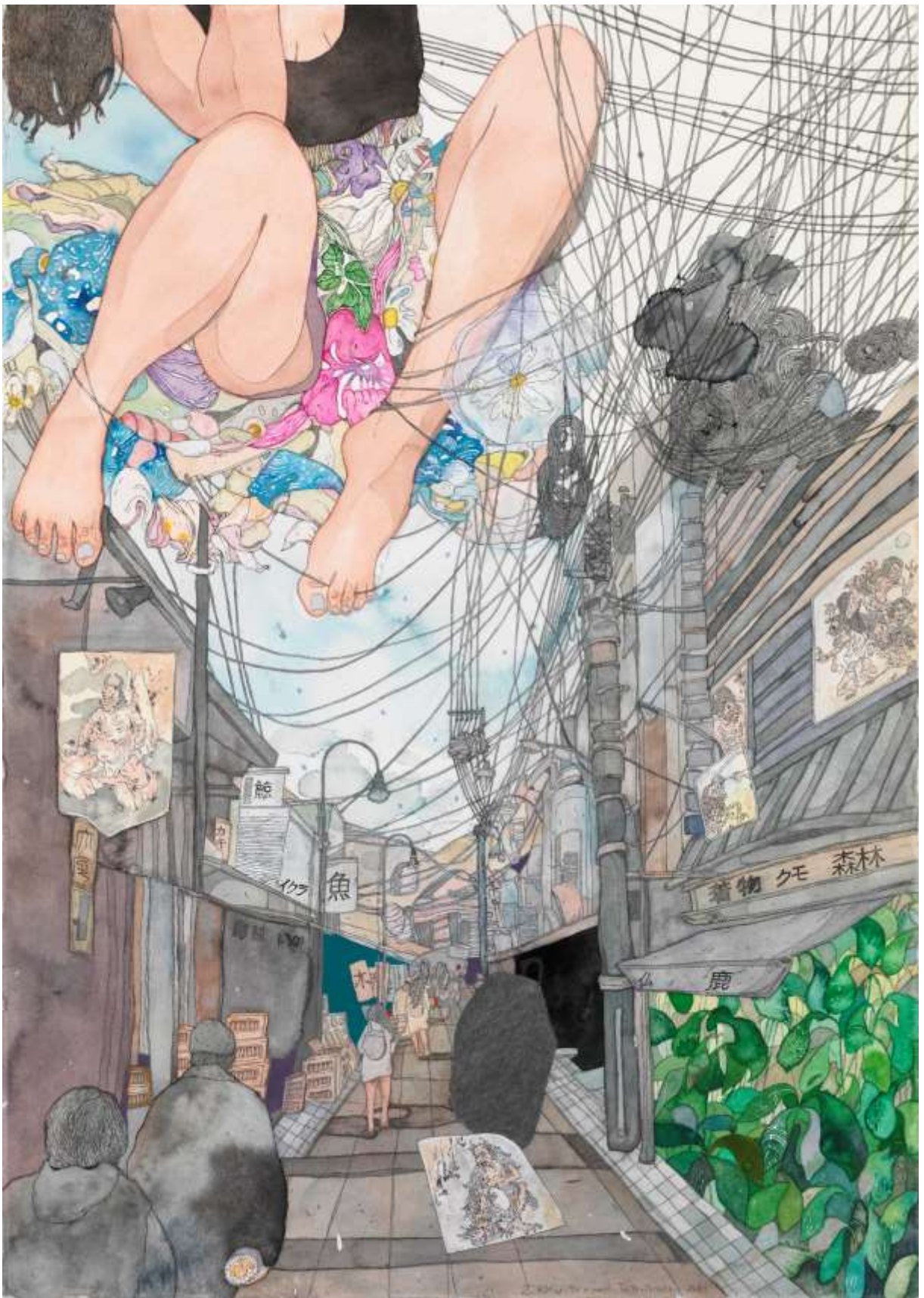
Το κιμονό-Taito Yanaka | The kimono Taito Yanaka 2021, Μεικτή τεχνική σε χαρτί | Mixed media on paper, 100 x 70 εκ. | cm