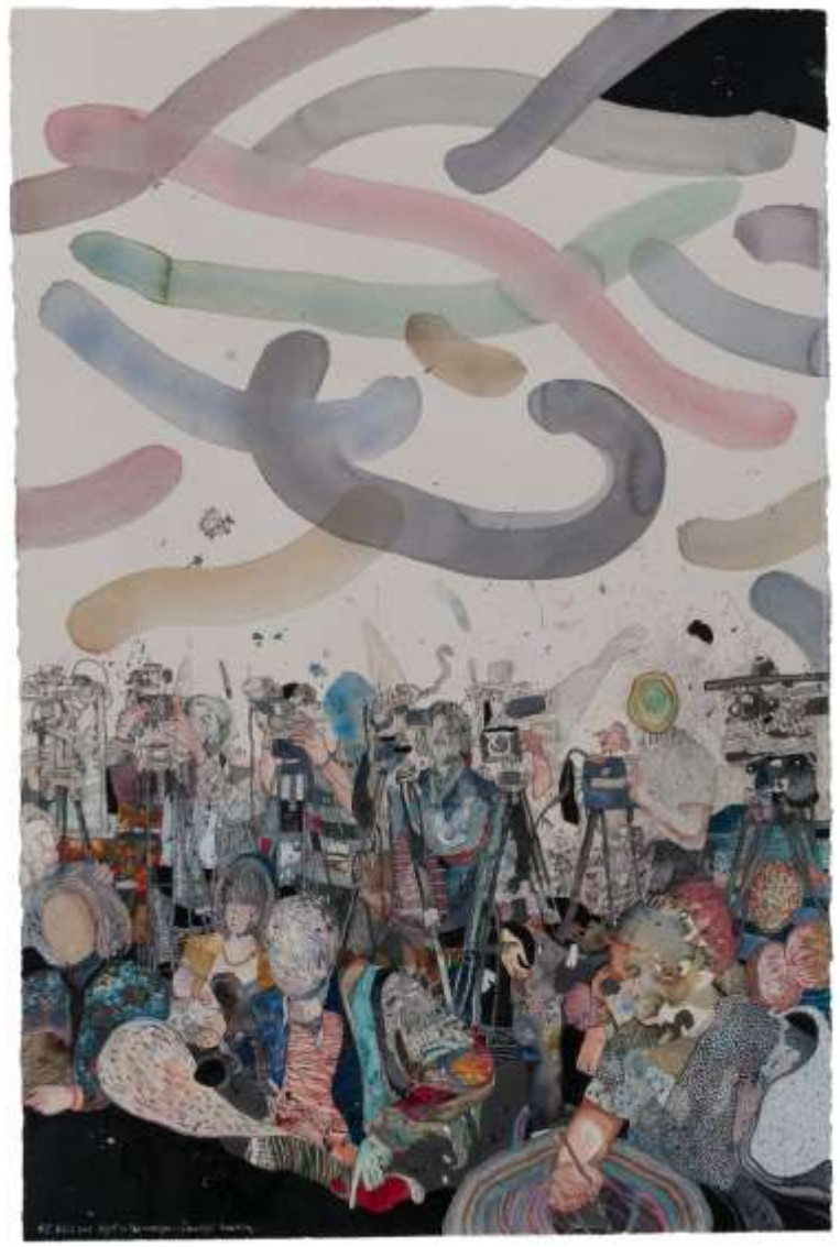
Loyal to the Campaign for a Beautiful Terrorism 2013 Δίπτυχο | Diptych, Μεικτή τεχνική σε χαρτί | Mixed media on paper, 174 x 134 εκ. | cm