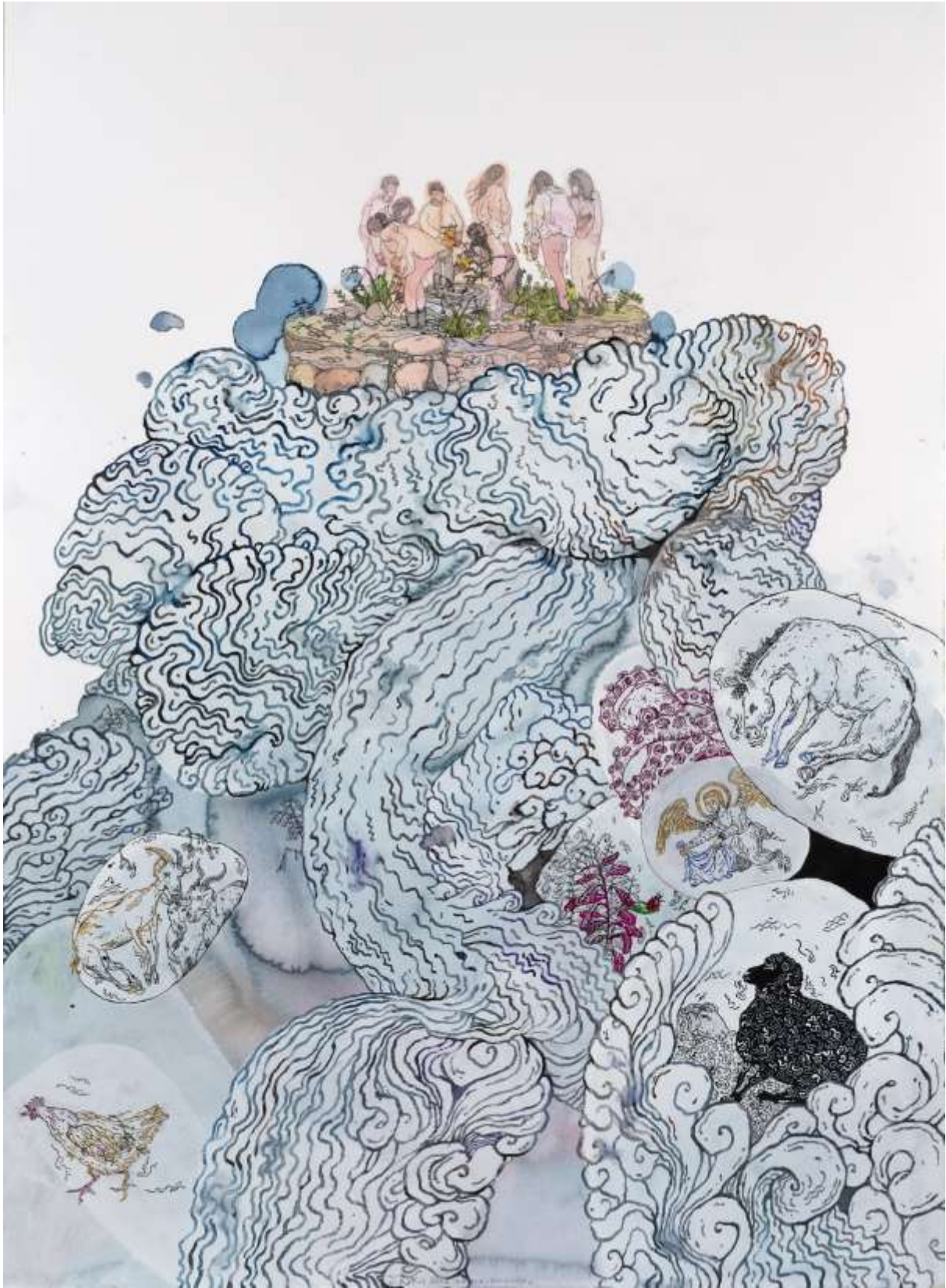
Ενθύμιο | Keepsake 2022, Μεικτή τεχνική σε χαρτί | Mixed media on paper, 151 x 122 εκ. | cm