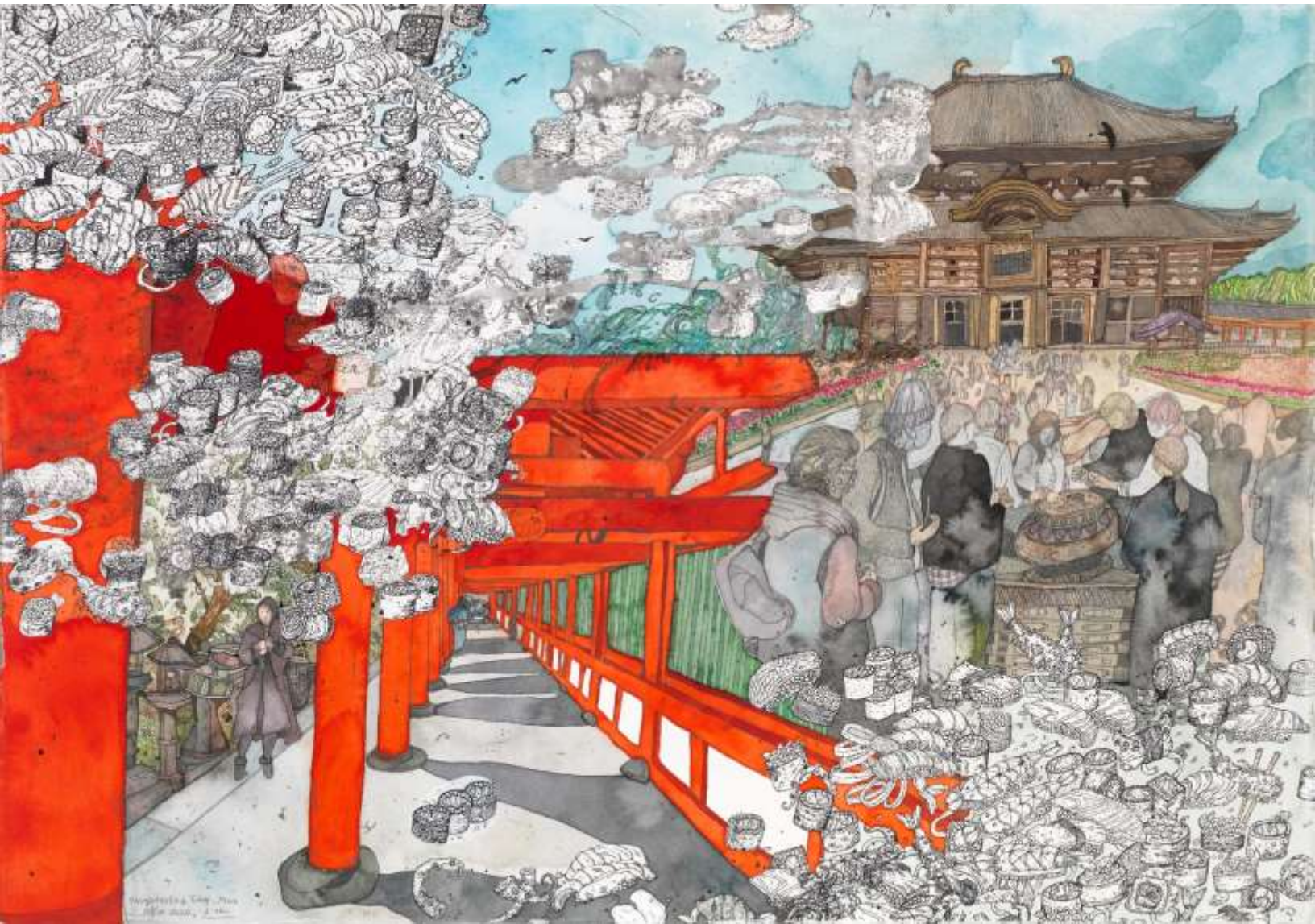
Kasuga taisha & Todayi, Nara-Οι 2 Ναοί | The 2 Temples 2020, Μεικτή τεχνική σε χαρτί | Mixed media on paper, 70 x 100 εκ. | cm