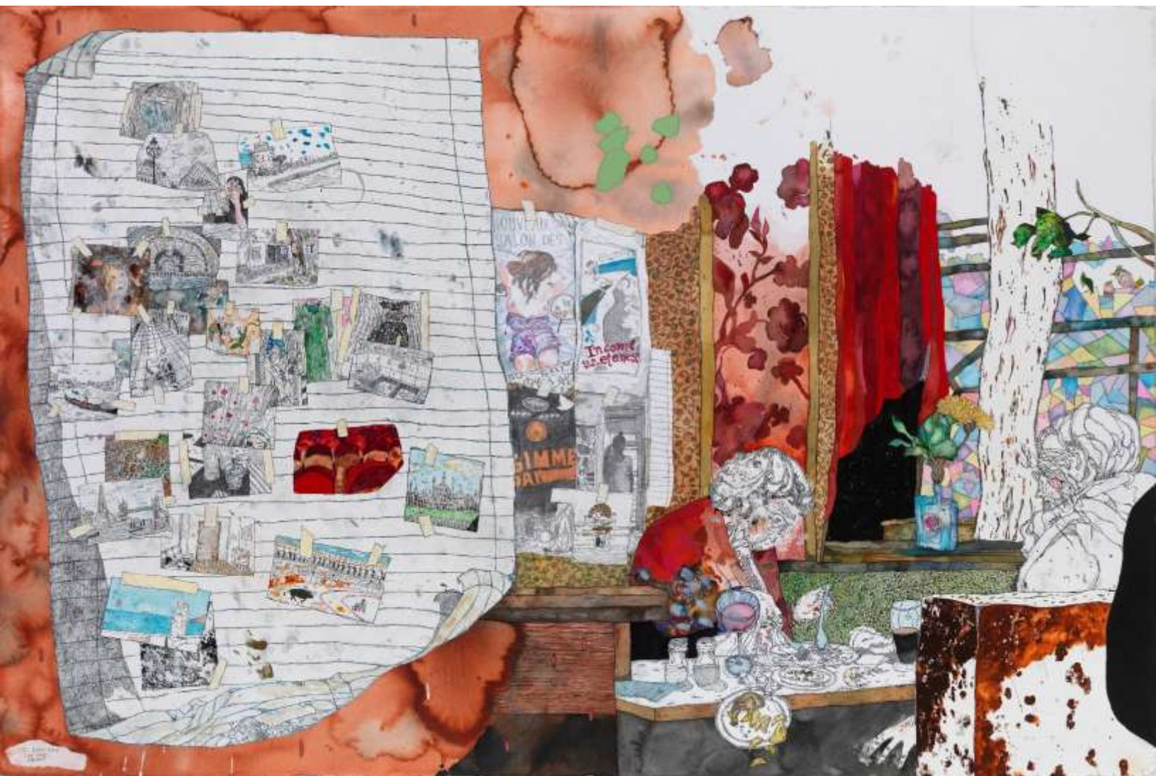
Love Letter, 2017, Μεικτή τεχνική σε χαρτί | Mixed media on paper, 150 x 100 εκ. | cm