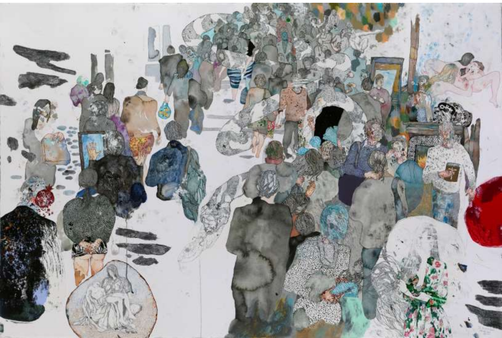
Oh my Lord, 2017, Μεικτή τεχνική σε χαρτί | Mixed media on paper, 150 x 100 εκ. | cm