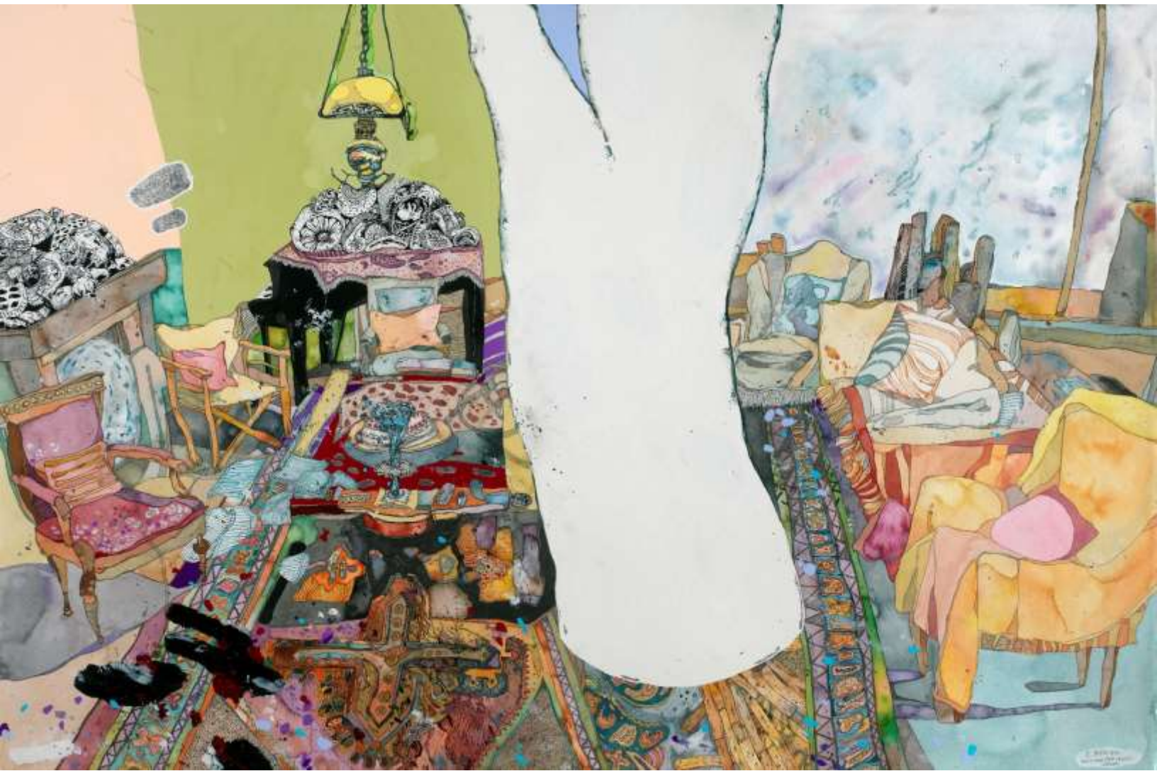
And No More Shall We Part, 2016, Μεικτή τεχνική σε χαρτί | Mixed media on paper, 150 x 100 εκ. | cm