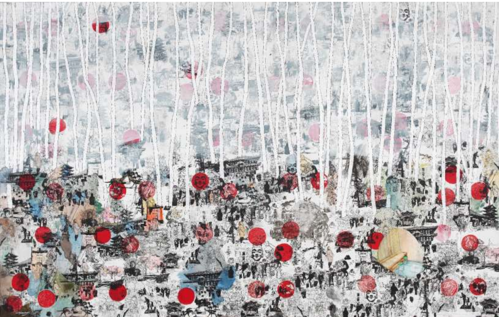
Θόρυβος στην Ιαπωνία-Το δάσος με τα μπαμπού | Noise in Japan-The forest with the baboo 2020 Μεικτή τεχνική σε μουσαμά | Mixed media on canvas, 190 x 300 εκ. | cm