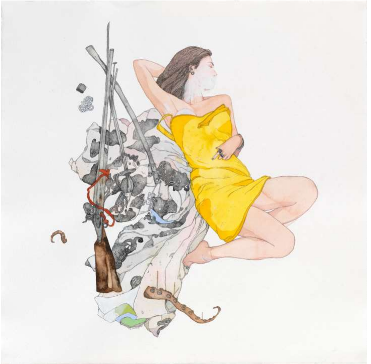
10 years of Horror & Romance, 2020, Μεικτή τεχνική σε χαρτί | Mixed media on paper, 70 x 70 εκ. | cm