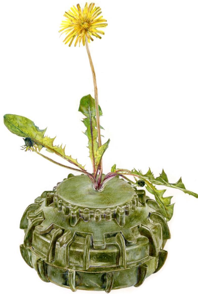
Taraxacum cyrium H. Lindb. fil. (Endemic of Cyprus) -TS-50, 2024, Μολύβια ακουαρέλας σε χαρτί | Watercolor pencils on paper, 42 x 32 εκ. | cm.