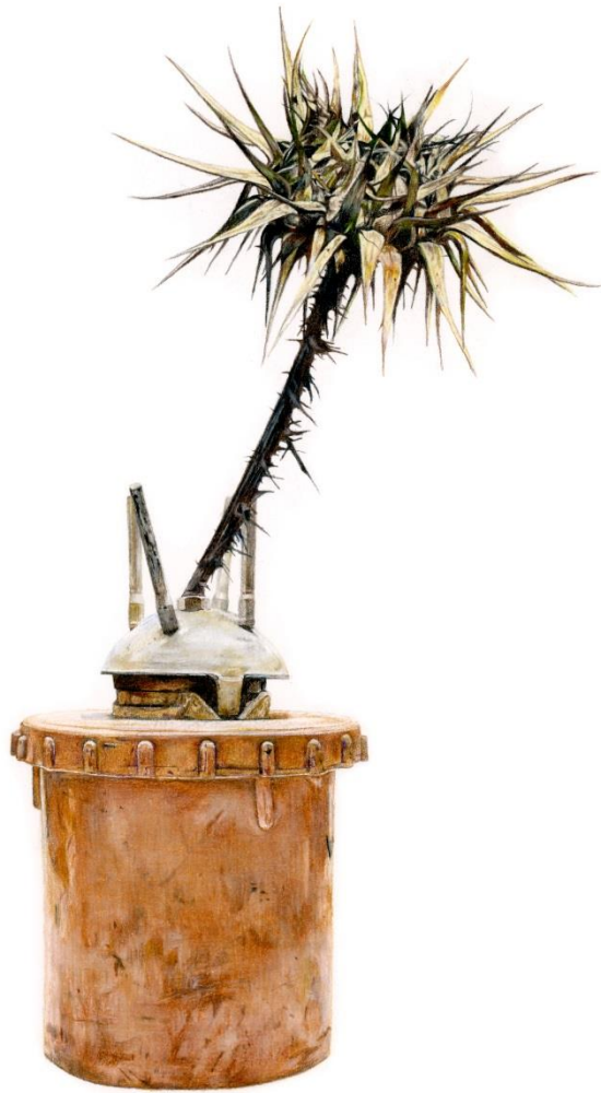
Oporordum cypricum Eig (Endemic of Cyprus) - V-69, 2024, Μολύβια ακουαρέλας σε χαρτί | Watercolor pencils on paper, 42 x 32 εκ. | cm.