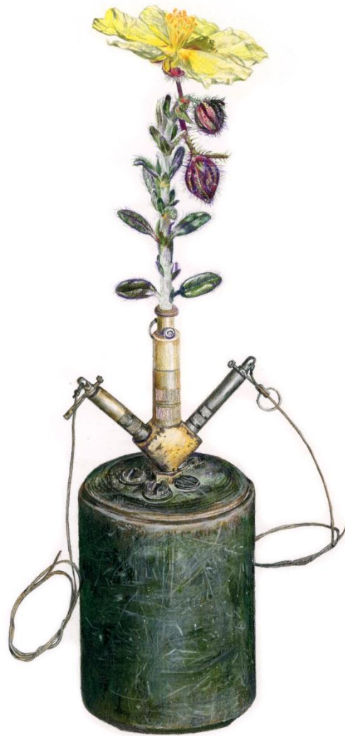
Helianthemum obtusifolium Dunal (Endemic of Cyprus) - S-Mine, 2023, Μολύβια ακουαρέλας σε χαρτί | Watercolor pencils on paper, 42 x 32 εκ. | cm.