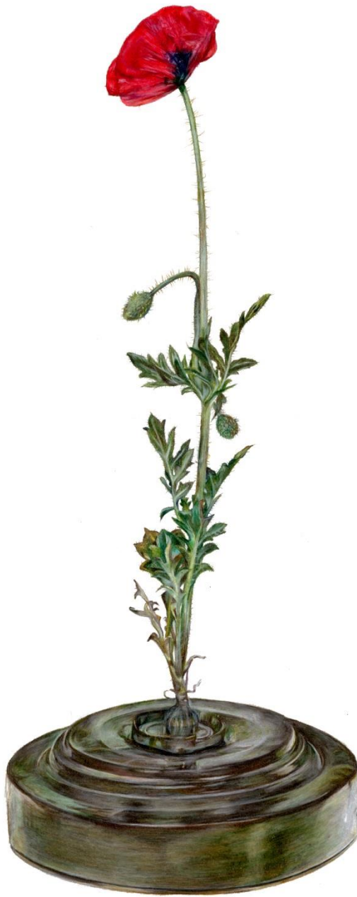
Papaver rhoeas, 2021

Μολύβια ακουαρέλας σε χαρτί | Watercolor pencils on paper, 29,7 x 21 εκ. | cm.