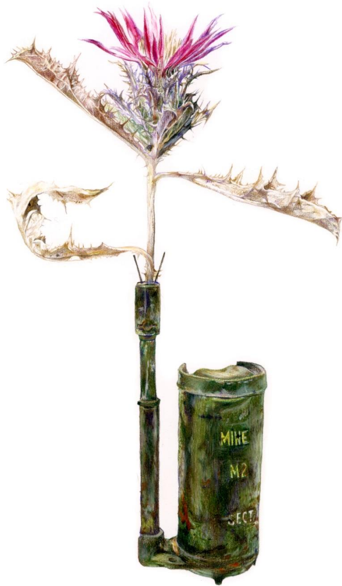
Carlina pygmaea (Post) Holmboe (Endemic of Cyprus) - M2, 2023, Μολύβια ακουαρέλας σε χαρτί | Watercolor pencils on paper, 42 x 32 εκ. | cm.