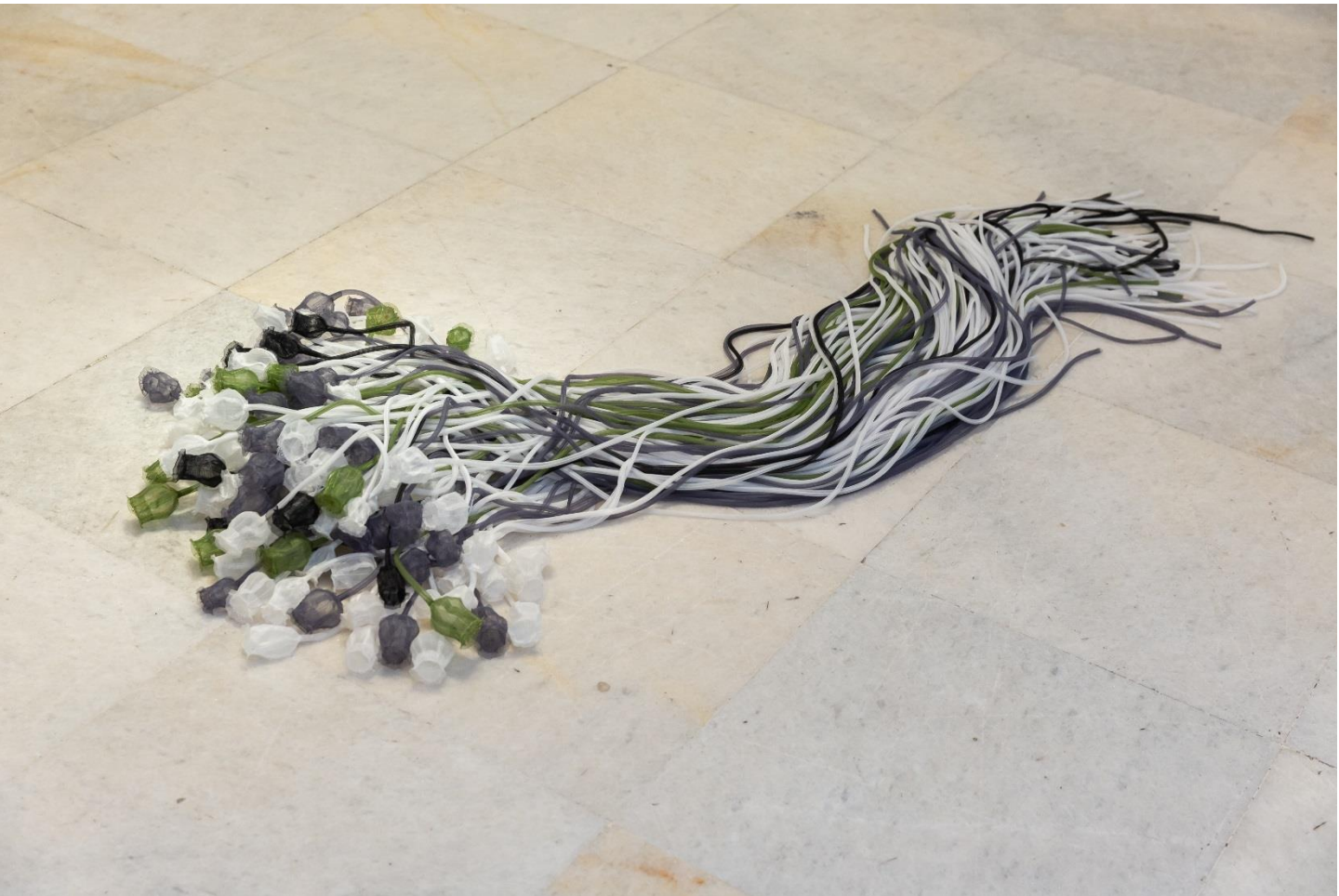
Σορός IV, | Remains IV, 2023, Συνθετική οργάντζα & κλωστή, χειροποίητο κέντημα, ραφή στο χέρι και στη μηχανή | Synthetic organza & thread, handmade embroidery, hand and machine sewing, Μεταβλητές διαστάσεις | Dimensions variable