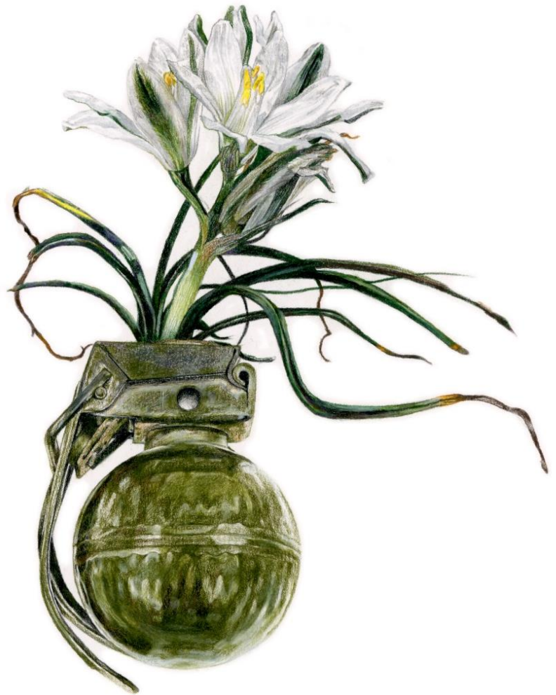
Ornithogalum trichophyllum Boiss. & Heldr. - Hand Grenade V-40, 2023, Μολύβια ακουαρέλας σε χαρτί | Watercolor pencils on paper, 42 x 32 εκ. | cm.