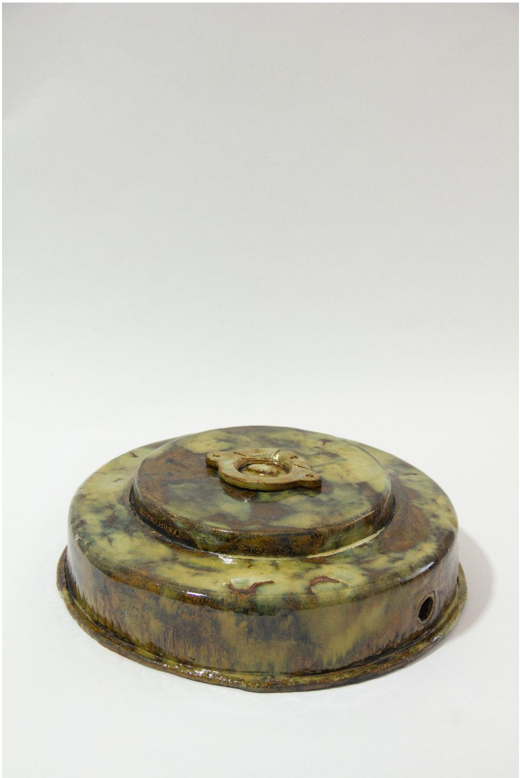
Νάρκη M15 | Landmine M15 , 2023, Πηλός stoneware με σμάλτο | Enameled stoneware clay, 36 x 13 x 13 εκ. | cm, 6 πολλαπλά αντίτυπα | Edition of 6, unique variations