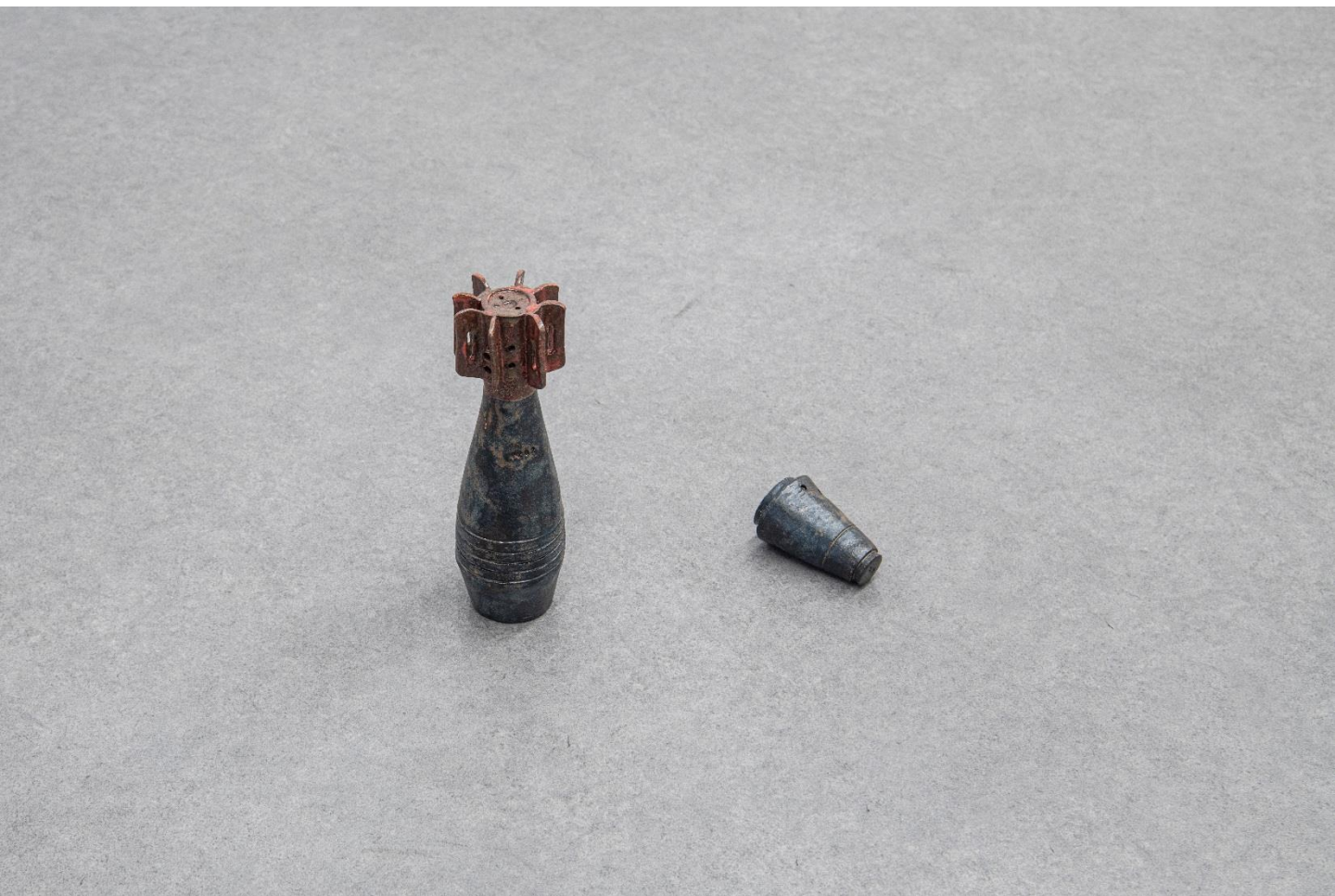
Οβίδα M49A2 | Mortar Shell M49A2, 2023, Πηλός stoneware με σμάλτο | Enameled stoneware clay, 26 x 8 x 8 εκ. | cm, 7 πολλαπλά αντίτυπα | Edition of 7, unique variations