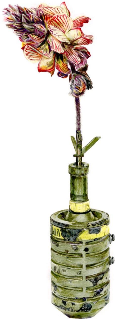
Onobrychis venosa (Desf.) Desv. (Endemic of Cyprus) - PMR3, 2023, Μολύβια ακουαρέλας σε χαρτί | Watercolor pencils on paper, 42 x 32 εκ. | cm.