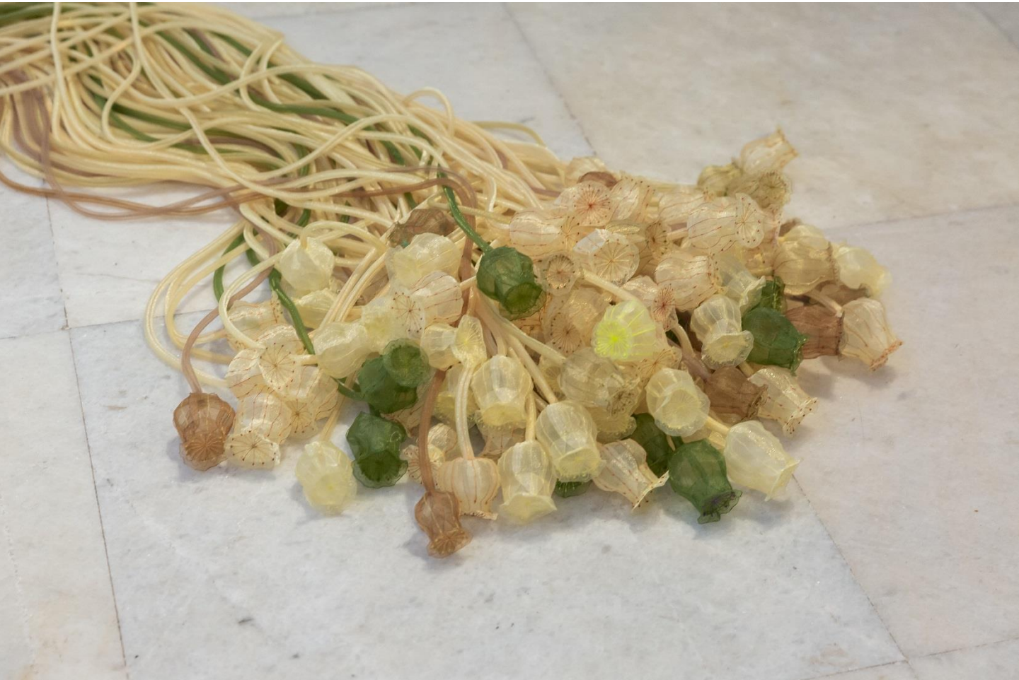
Σορός III | Remains III,, 2021/22, Συνθετική οργάντζα & κλωστή, χειροποίητο κέντημα, ραφή στο χέρι και στη μηχανή | Synthetic organza & thread, handmade embroidery, hand and machine sewing, Μεταβλητές διαστάσεις | Dimensions variable