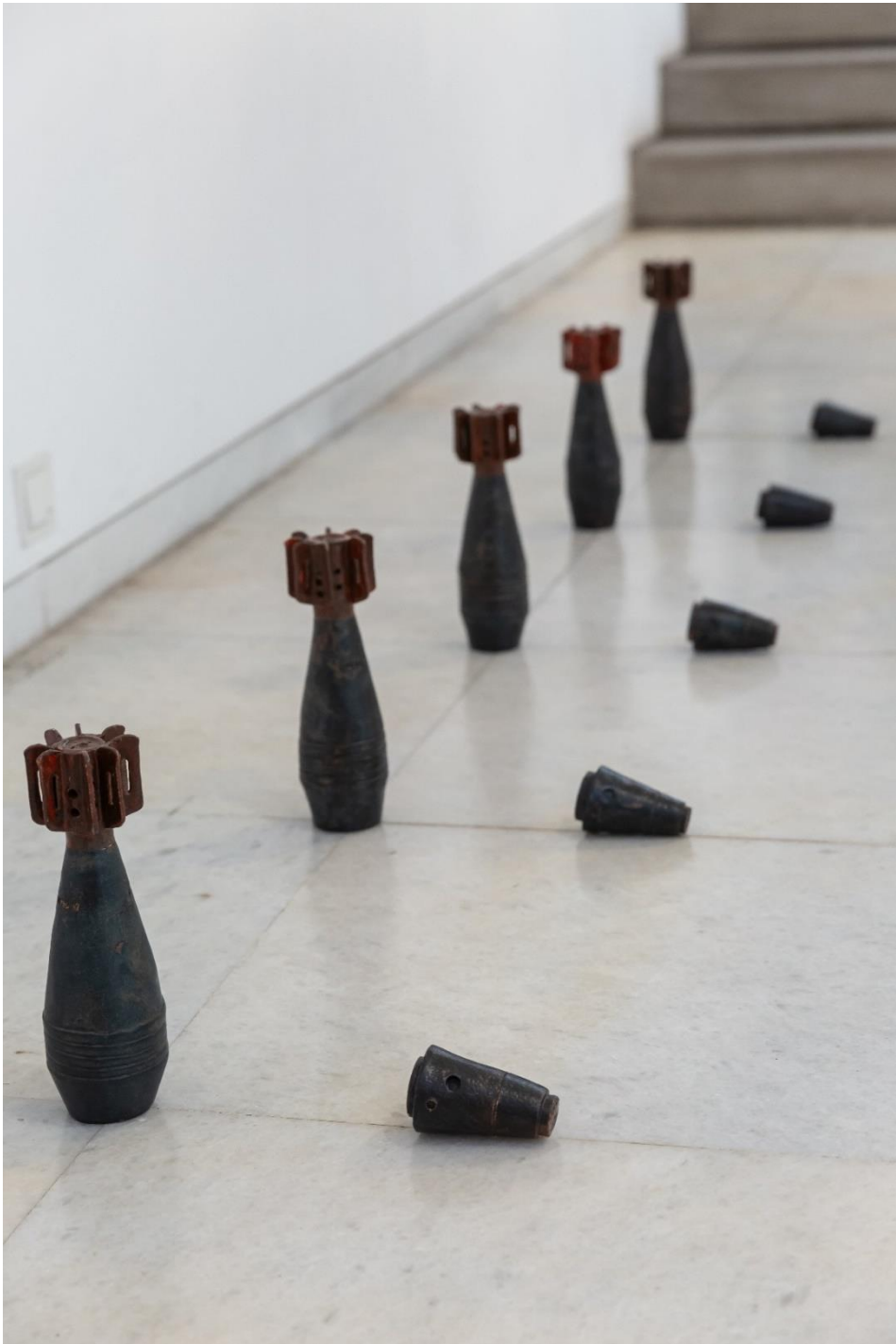
Άποψη Εγκατάστασης | Installation View