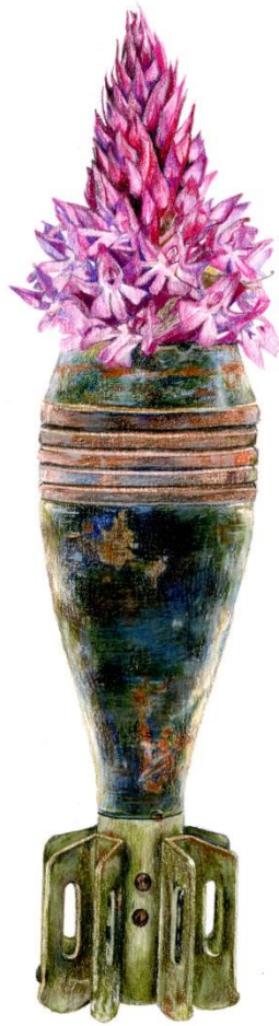
Anacamptis pyramidalis (L.) L. C. M. Richard - Mortar Shell, 2023, Μολύβια ακουαρέλας σε χαρτί | Watercolor pencils on paper, 42 x 32 εκ. | cm