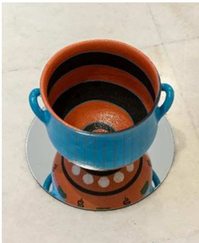
Αγγείο του Χρόνου I | Vassel of Time I, 2023, Εφωαλωμένο κεραμικό, ζωγραφισμένο στο χέρι, καθρέφτης, σίδηρο Glazed ceramic, hand painted, mirror, iron, 133 x 35 x 35 εκ. | cm