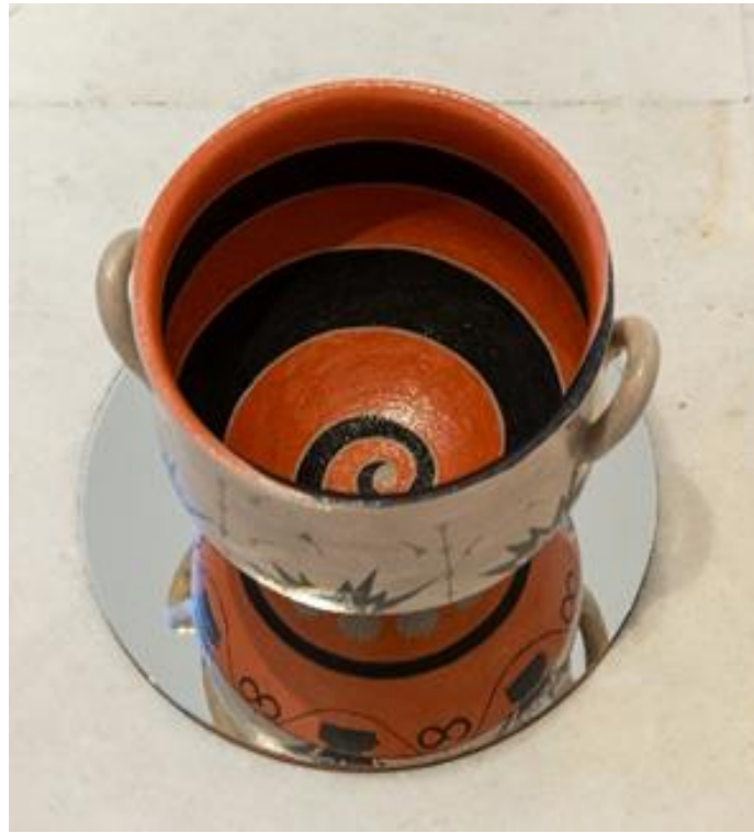
Αγγείο του Χρόνου II | Vassel of Time II, 2023, Εφασαλωμένο κεραμικό, ζωγραφισμένο στο χέρι, καθρέφτης, σίδηρο Glazed ceramic, hand painted, mirror, iron, 133 x 35 x 35 εκ. | cm