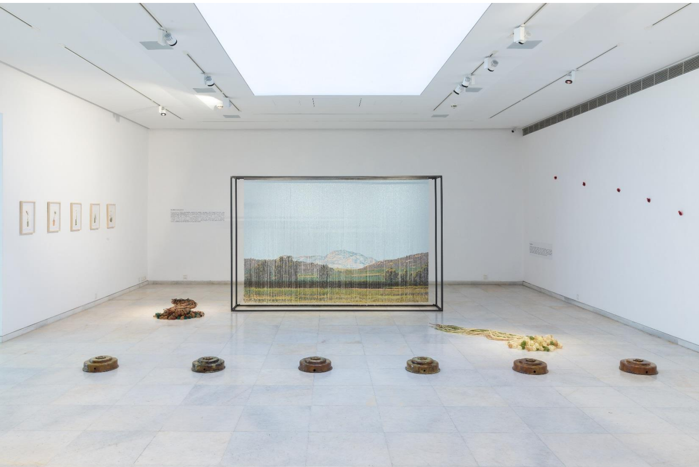
Άποψη Εγκατάστασης | Installation View