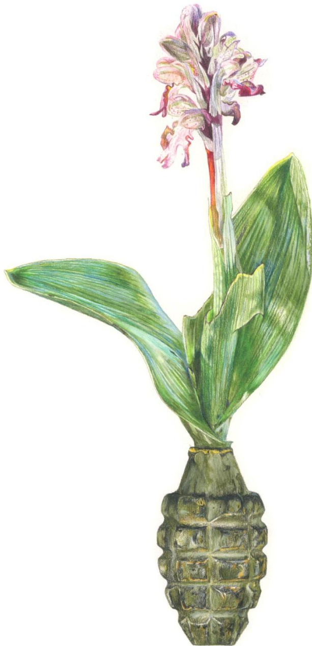
Barlia robertiana (Loisel.) Greuter - Grenade, 2023, Μολύβια ακουαρέλας σε χαρτί | Watercolor pencils on paper, 42 x 32 εκ. | cm.