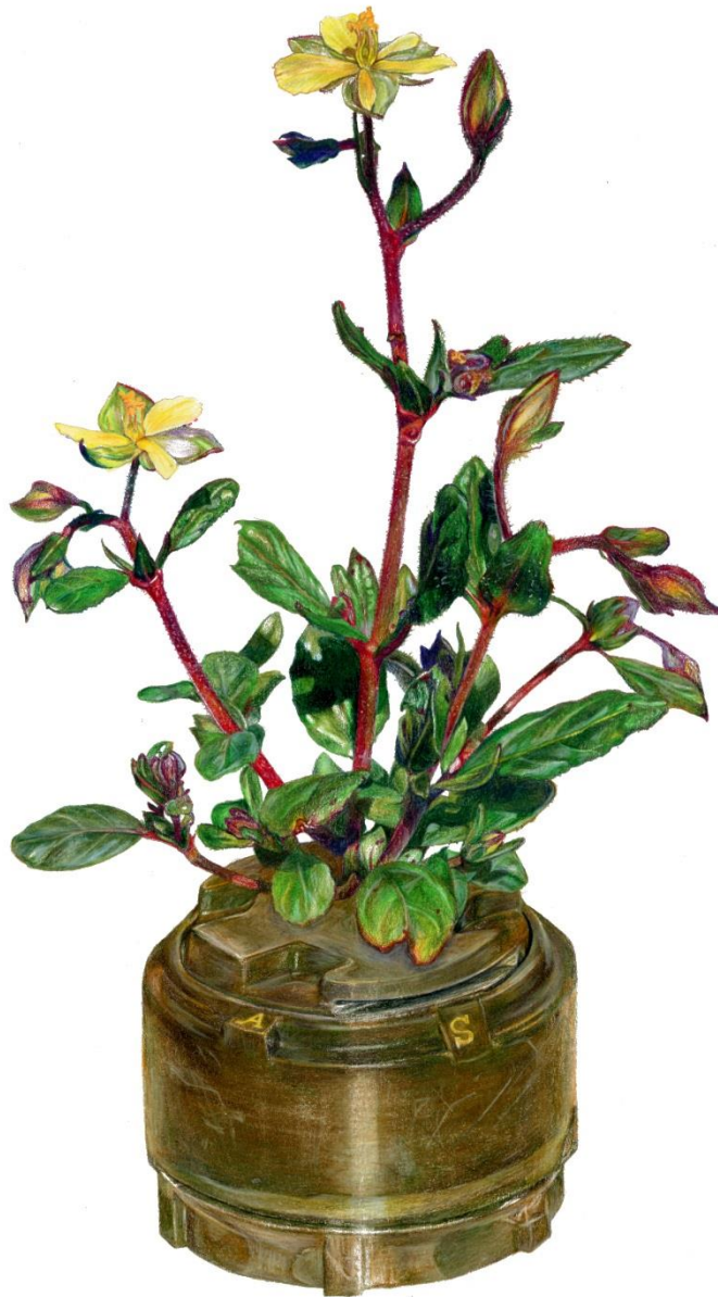
Helianthemum salicifolium (L.) Miller var. glabrum Meikle (Endemic of Cyprus) - M14, 2022, Μολύβια ακουαρέλας σε χαρτί | Watercolor pencils on paper, 42 x 32 εκ. | cm.