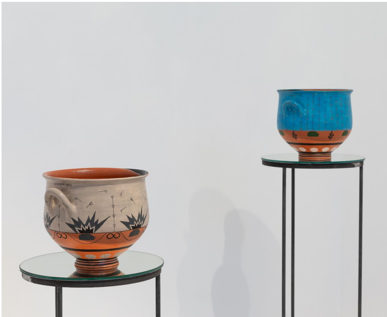
Άποψη Εγκατάστασης | Installation View