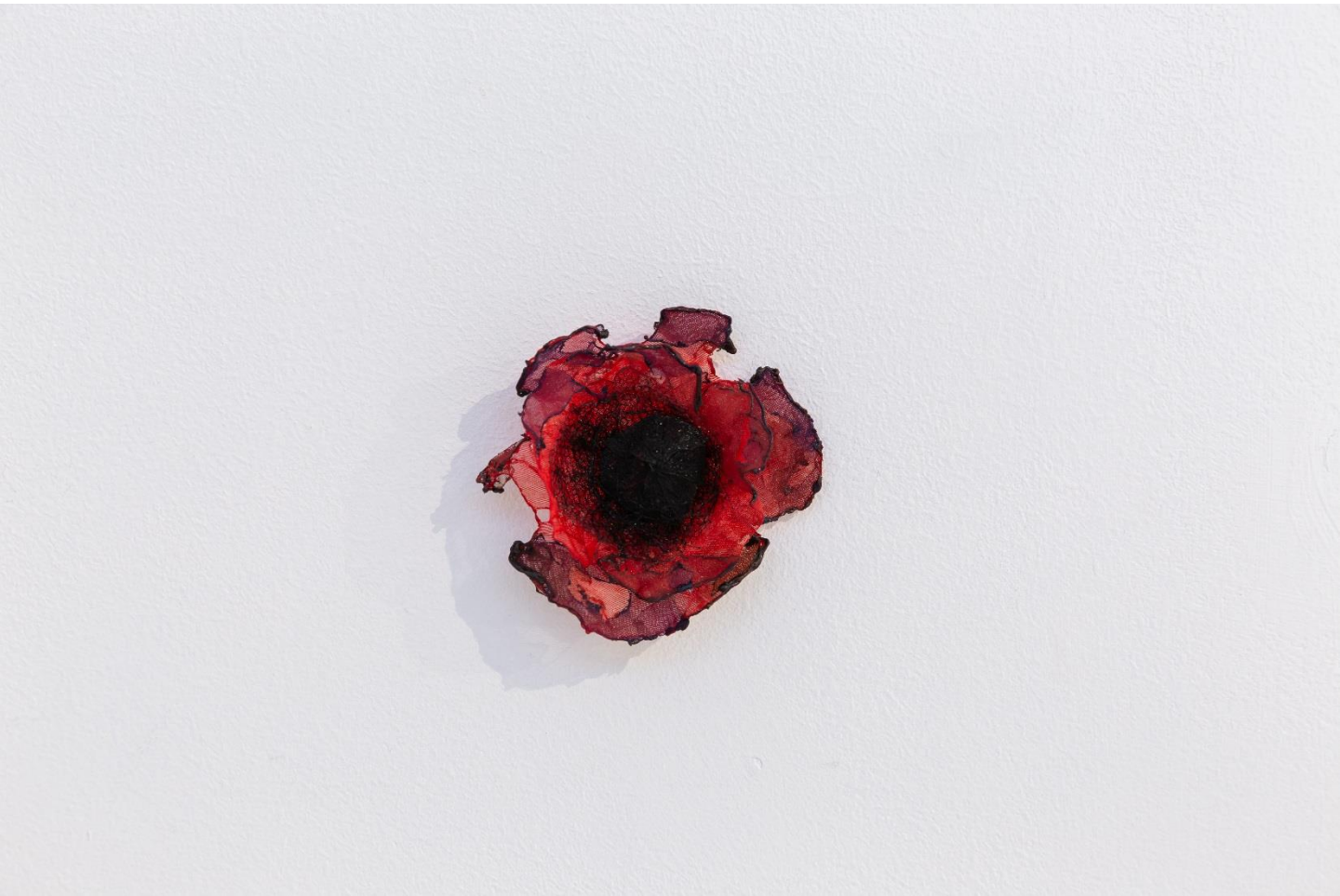
Άποψη Εγκατάστασης | Installation View