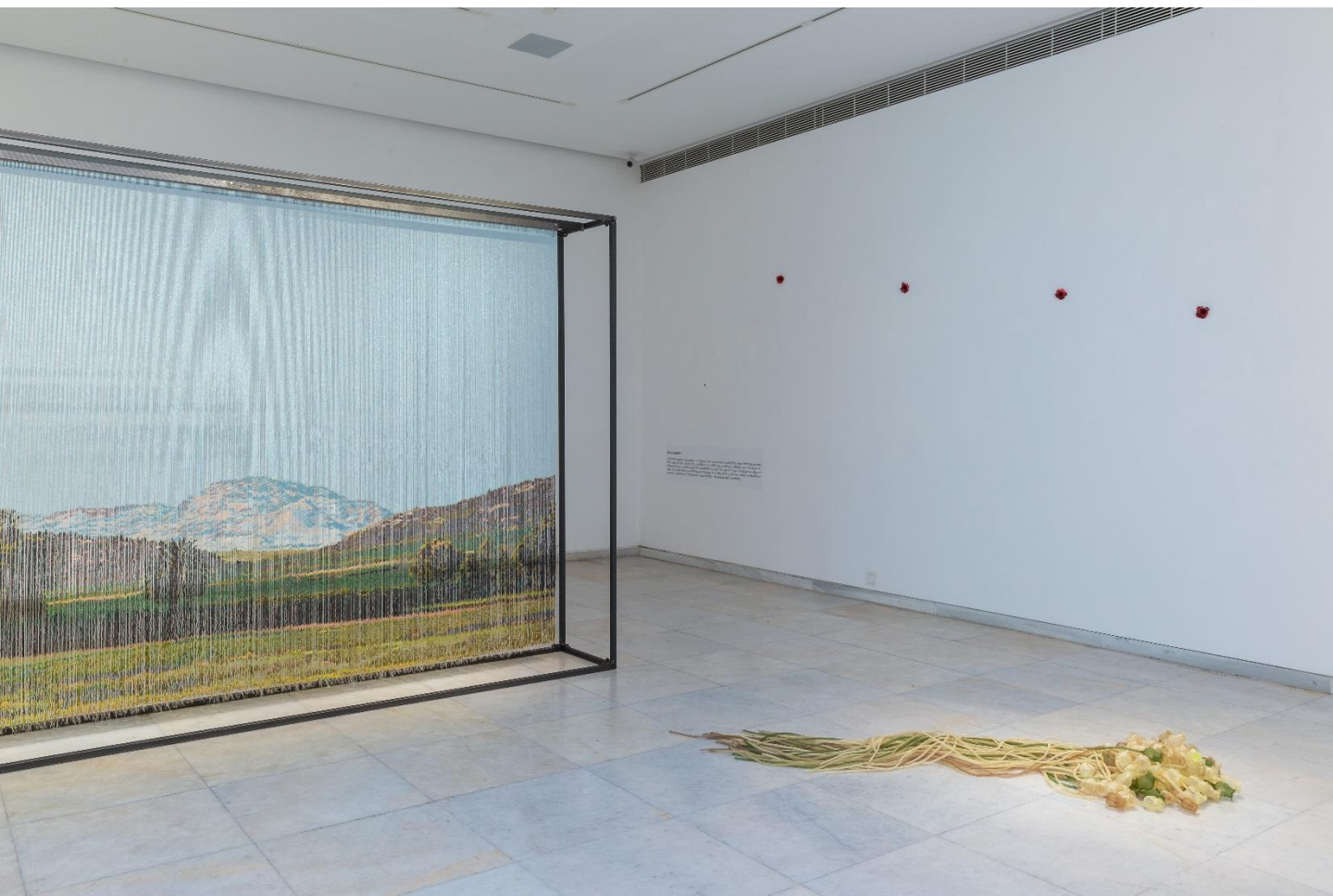
Άποψη Εγκατάστασης | Installation View