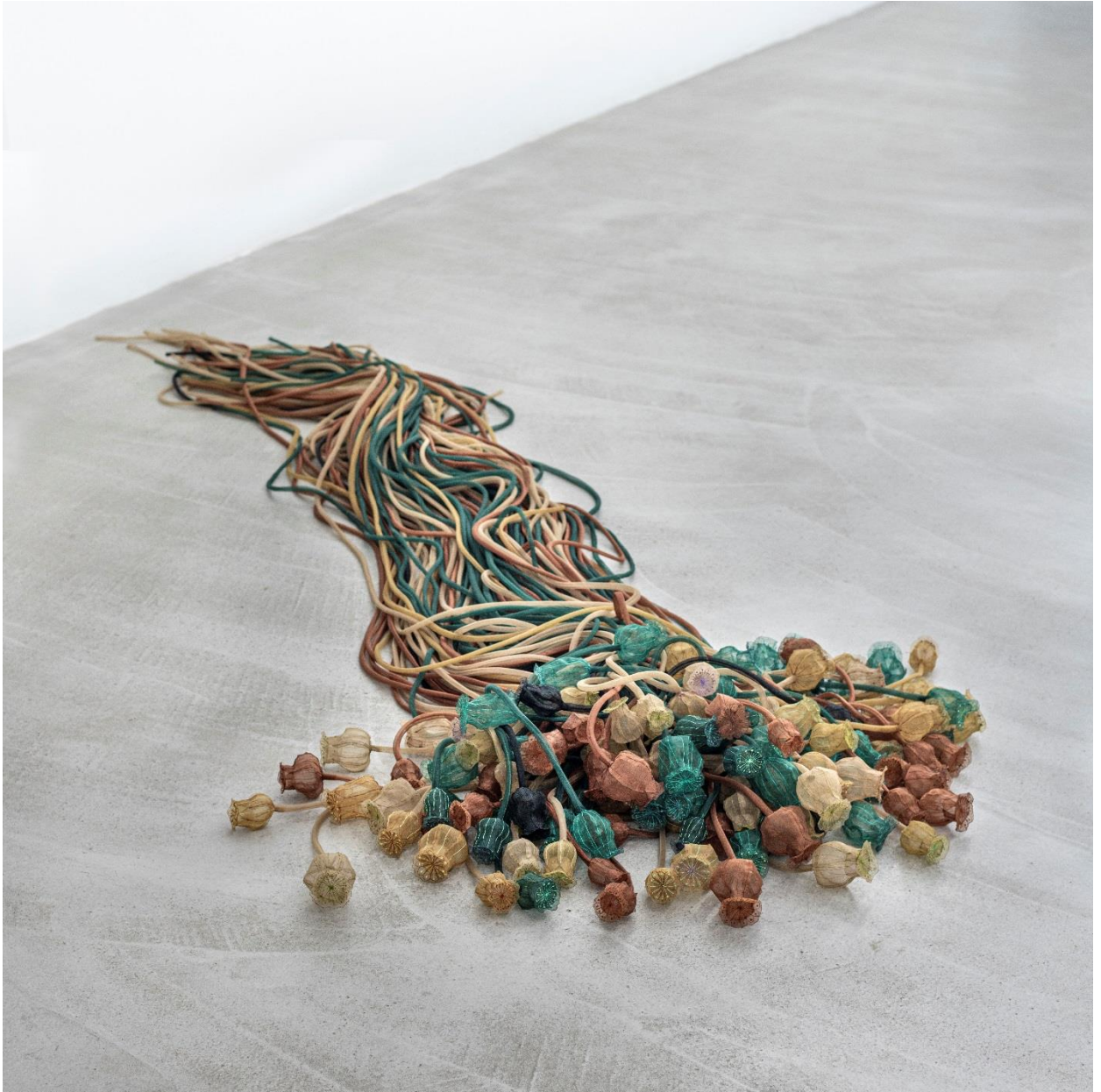
Σορός II | Remains II, 2021/22, Συνθετική οργάντζα & κλωστή, χειροποίητο κέντημα, ραφή στο χέρι και στη μηχανή | Synthetic organza & thread, handmade embroidery, hand and machine sewing, Μεταβλητές διαστάσεις | Dimensions variable Ιδιωτική Συλλογή | Private Collection