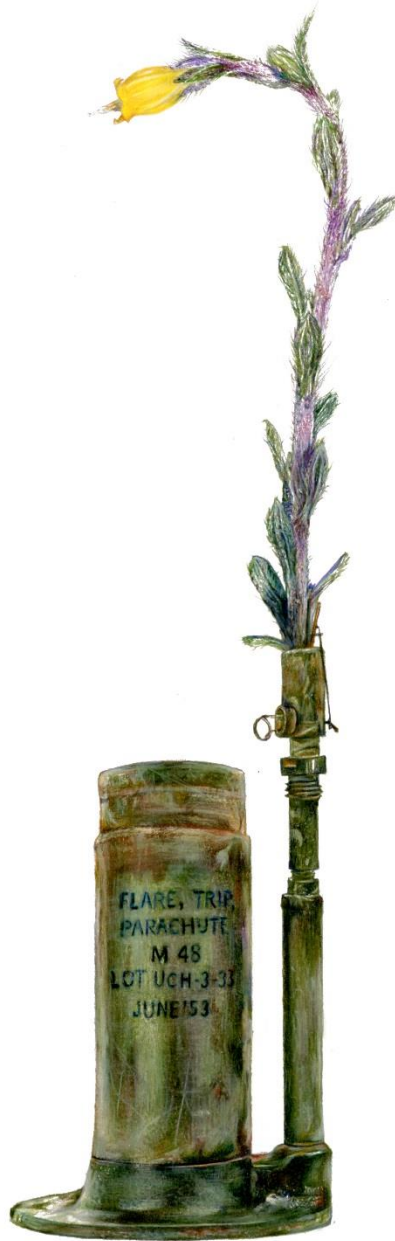
Onosma fruticosum Sm. (Endemic of Cyprus) -M48, 2022, Μολύβια ακουαρέλας σε χαρτί | Watercolor pencils on paper, 42 x 32 εκ. | cm.