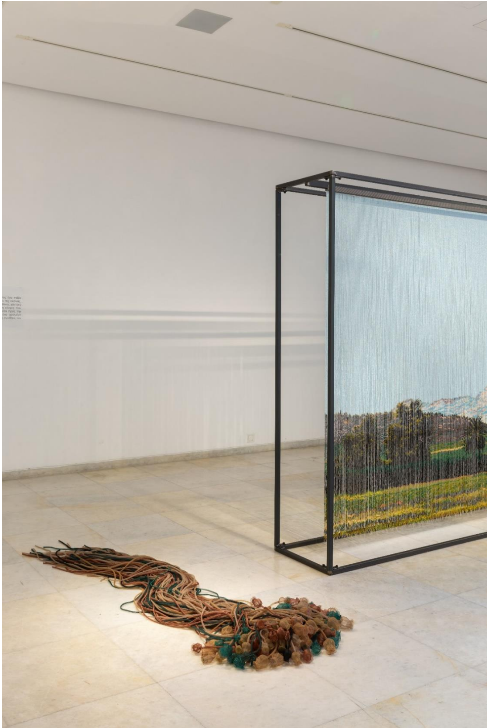
Άποψη Εγκατάστασης | Installation View