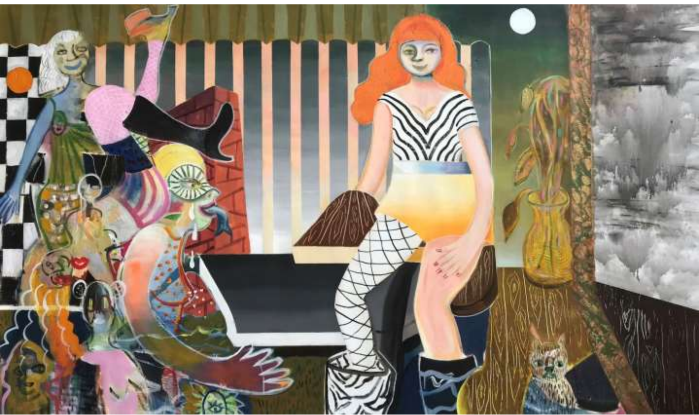
Access denied, 2022, Ακρυλικά σε καμβά | Acrylics on canvas, 120 x 200 εκ. | cm