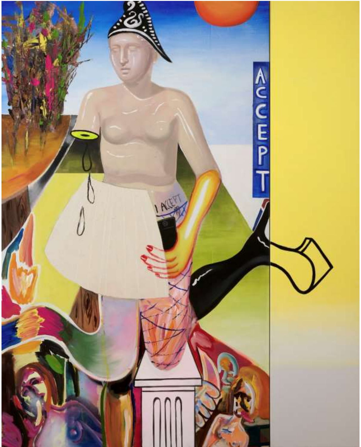
Terms and conditions, 2021, Ακρυλικά σε καμβά | Acrylics on canvas, 150 x 120 εκ. | cm