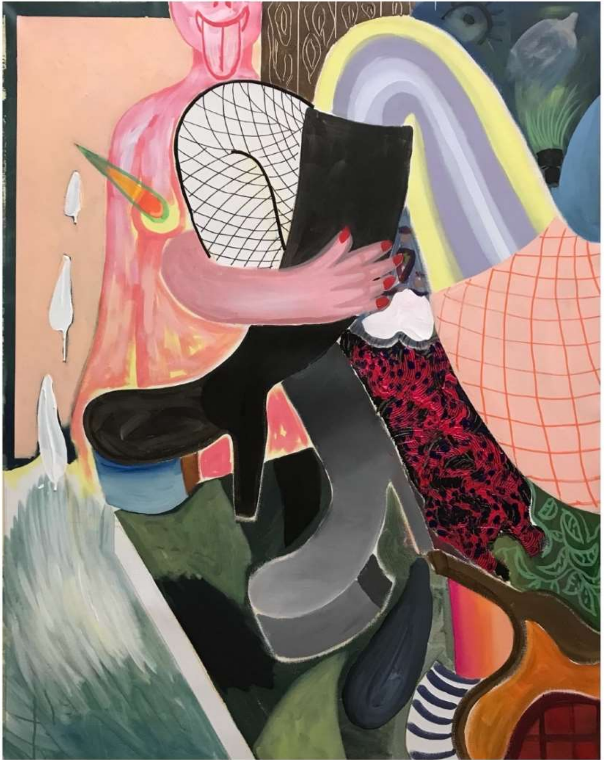
A boob for every boredom and a cigarette 2021 Ακρυλικά σε καμβά | Acrylics on canvas, 107 x 84 εκ. | cm