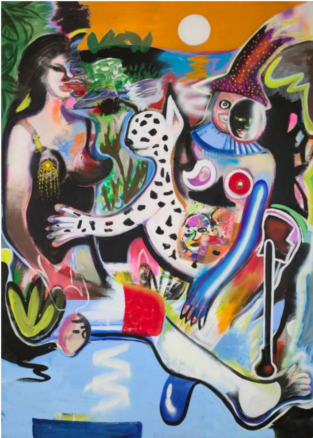
An urgency before the content, 2019 Ακρυλικά, παστέλ, σπρέι, κολάζ σε καμβά | Acrylic, pastels, spray, collage on canvas, 170 x 120 εκ. | cm