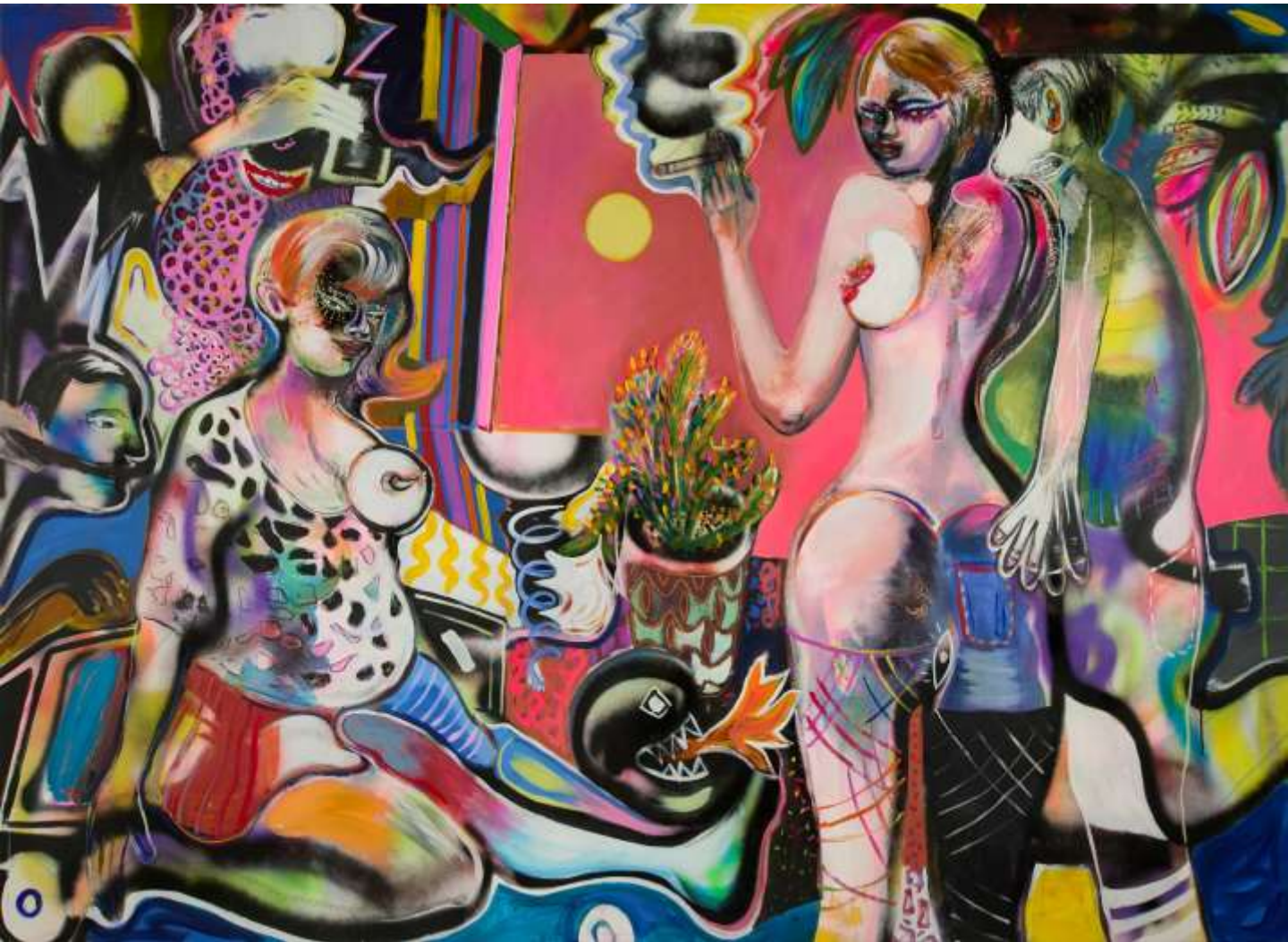
Some nonsense disabilities, 2019, Ακρυλικά σε καμβά | Acrylics on canvas, 150 x 200 εκ. | cm