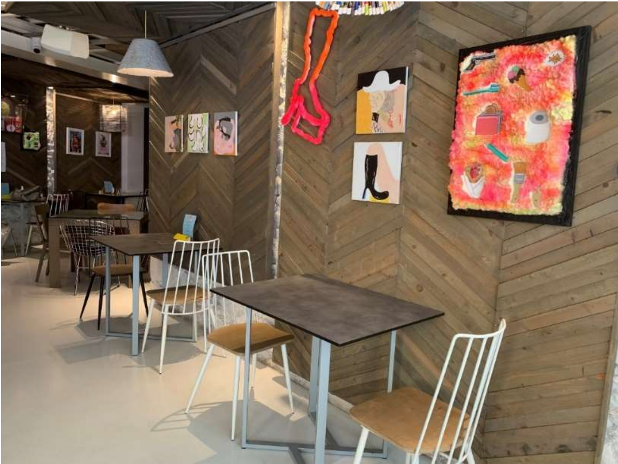
Άποψη Εγκατάστασης | Installation view | Survival Kit 2022, Shedia Home