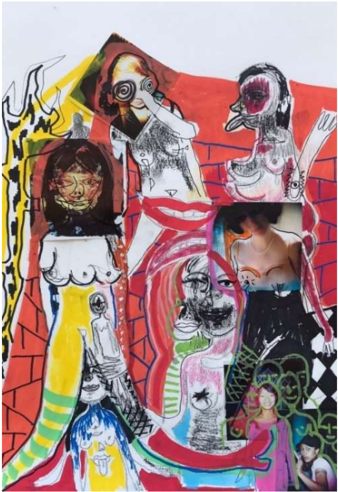
Χωρίς Τίτλο | Untitled I - VI 2022 , Μαρκασδόροι και κολλάζ σε χαρτί | Markers and collage on paper, 21 x 29 εκ. | cm