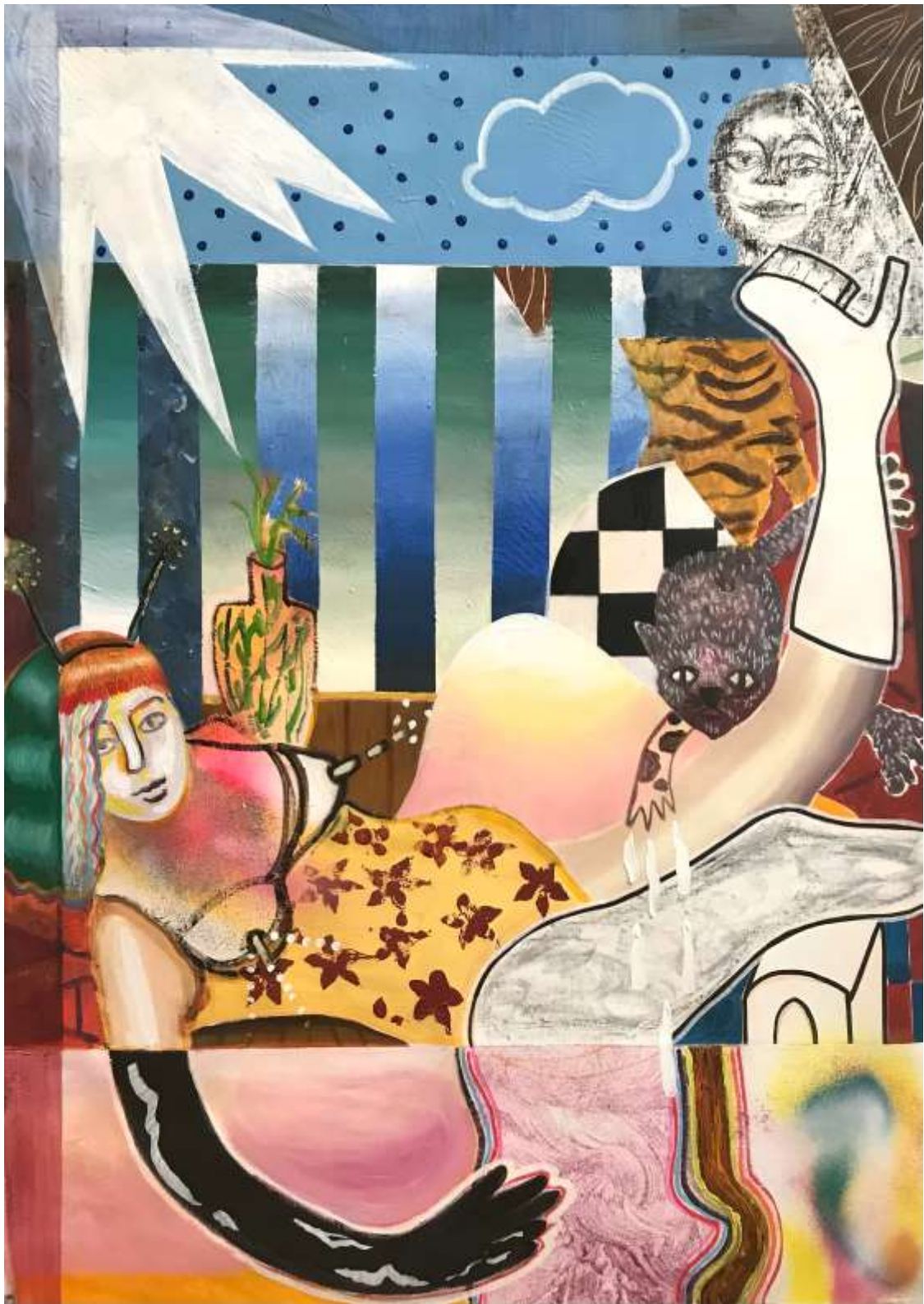
No love not spasm, a ghost 2022, Ακρυλικά σε καμβά | Acrylics on canvas, 132 x 94 εκ. | cm