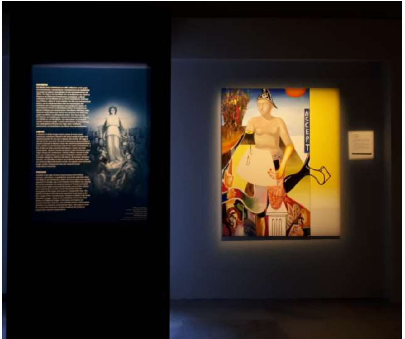
Άποψη Εγκατάστασης | Installation view | WAAG Exhibition 2021 Μουσείο Βυζαντινού Πολιτισμού Θεσσαλονίκης | Museum of Byzantine Culture Thessaloniki