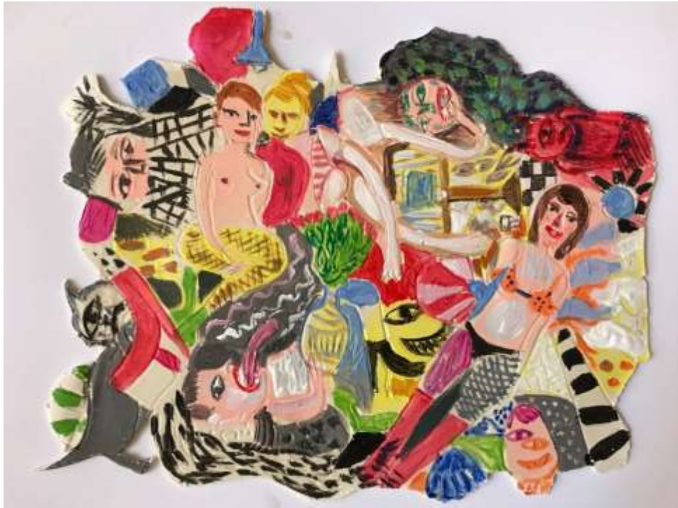
Composition for clay n.2, 2020, Ακρυλικά σε πηλό | Acrylics on clay 20 x 18 εκ. | cm