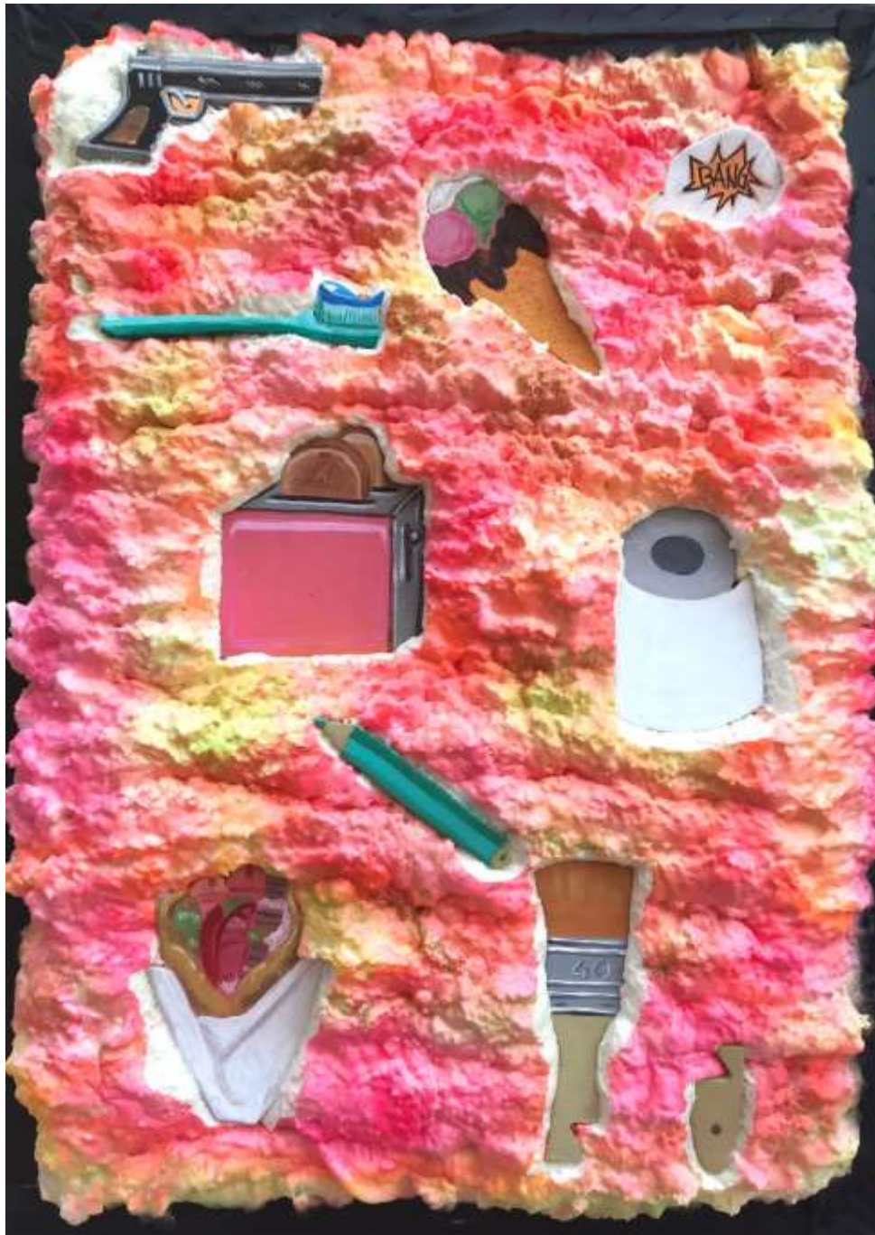
Survival Kit, 2022

Polyurethane foam, eva foam acrylic paint on canvas, 70 x 50 εκ. | cm