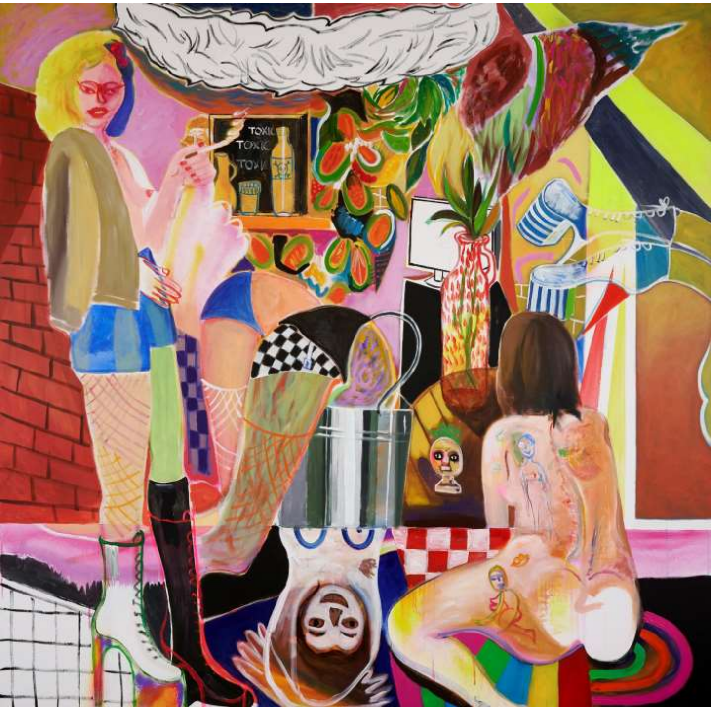
Venus has lost her furs, 2020

Ακρυλικό, σπρέι, παστέλ σε καμβά | Acrylic, spray, pastels on canvas 200 x 200 εκ. | cm