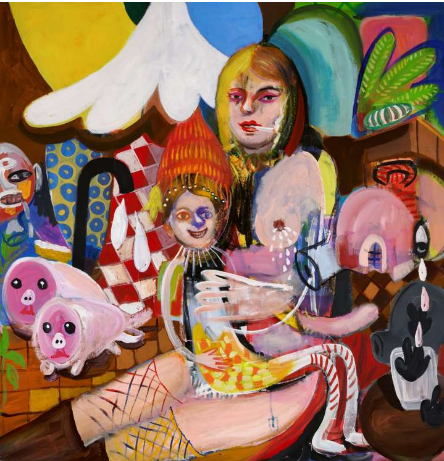
The suspected sick, 2020

Ακρυλικά, παστέλ σε καμβά | Acrylics, pastels on canvas | 100 x 97 εκ. | cm