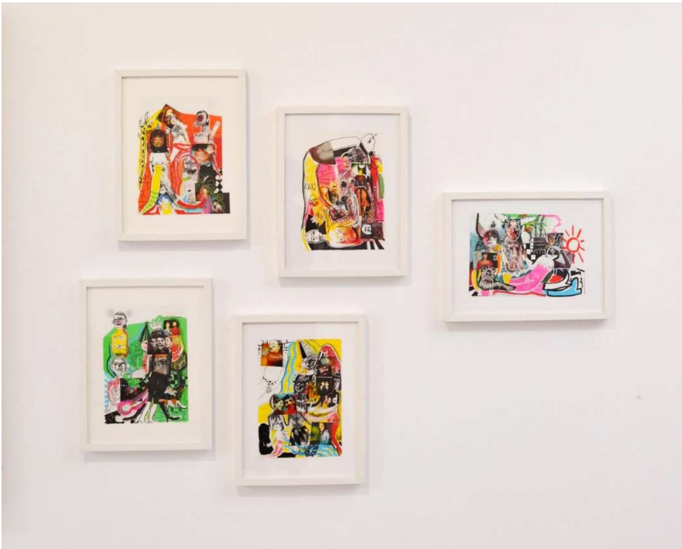
Άποψη Εγκατάστασης | Installation view | Open – ended 2022, Γκαλερί Ζουμπουλάκη | Zoumboulakis Galleries