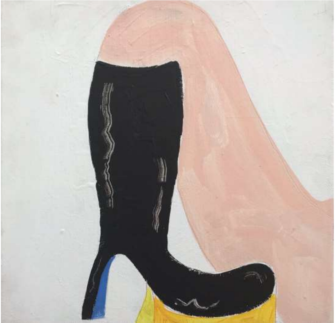
Χωρίς Τίτλο | Untitled, 2021, Ακρυλικά σε χαρτί | Acrylics on paper, 40 x 29 εκ. | cm