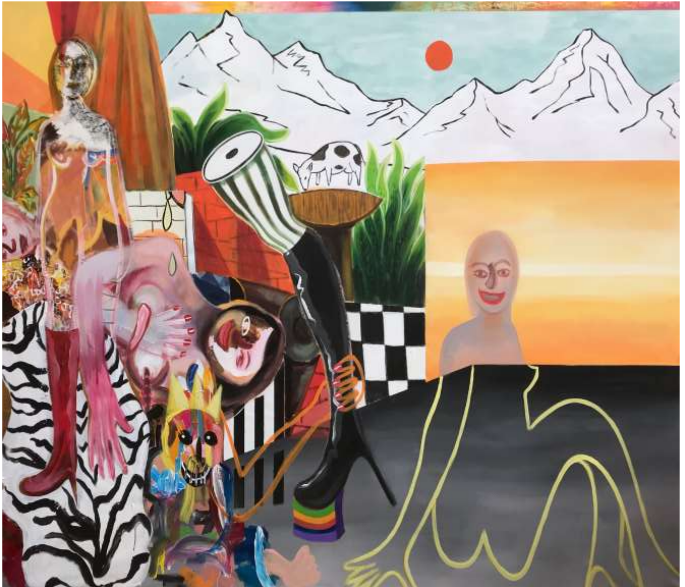
Naked life delirium 2021, Ακρυλικά σε καμβά | Acrylics on canvas, 156 x 200 εκ. | cm