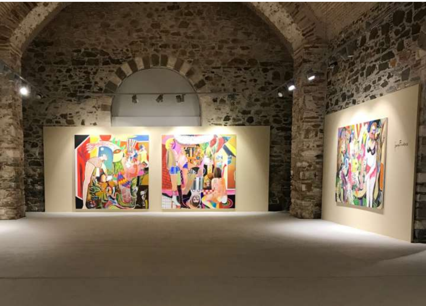
Άποψη Εγκατάστασης | Installation view, Entity Battlefields, Σύρος | Syros, 2020