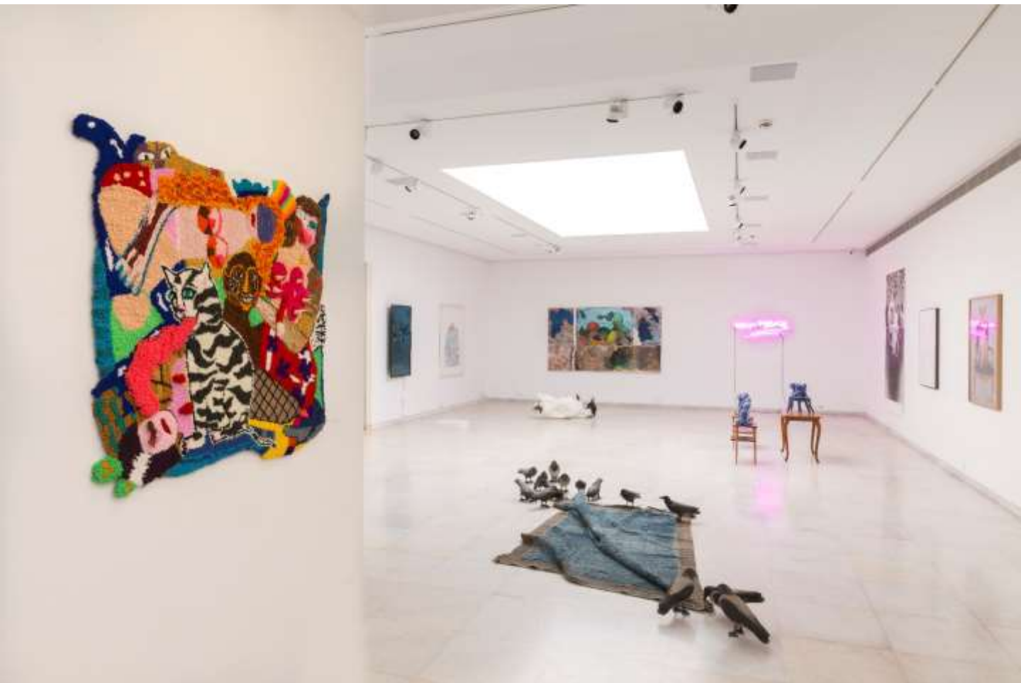
Άποψη Εγκατάστασης | Installation view | Animal Tales 2022, Γκαλερί Ζουμπουλάκη | Zoumboulakis Galleries