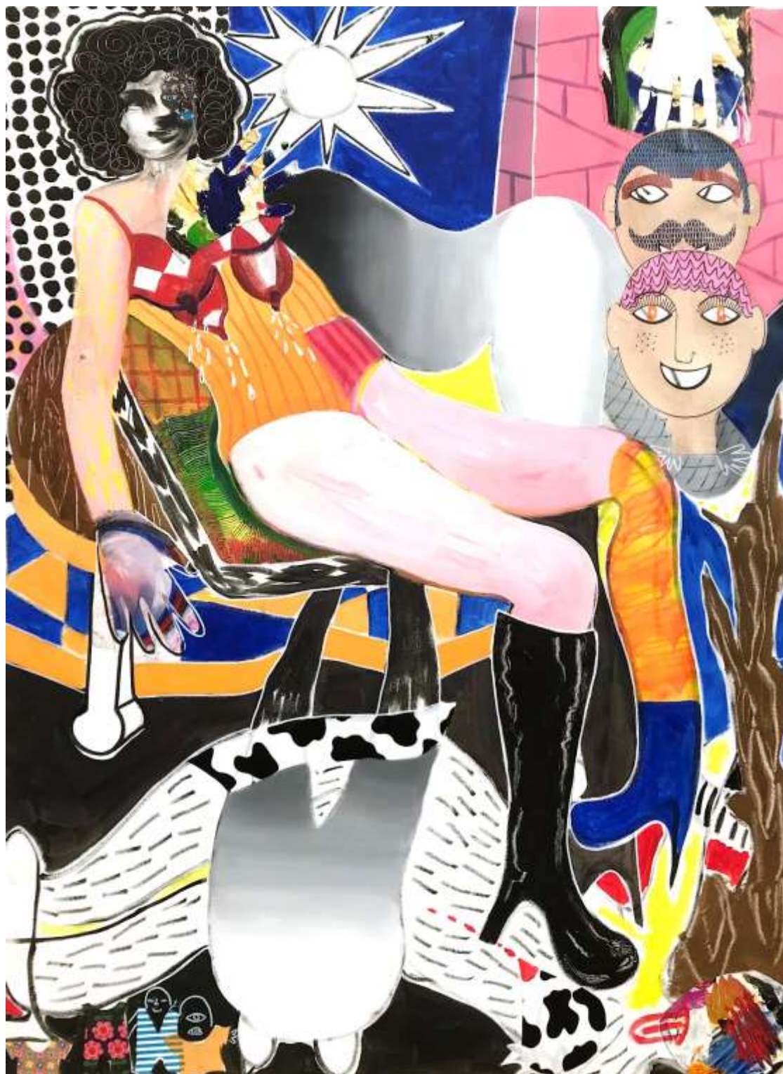
panoptical libidos of nonenties, 2022

Ακρυλικά, σπρέι, μαρκαδόροι, κολάζ | Acrylics, spray, markers ,collage, 130 x 90 εκ. | cm